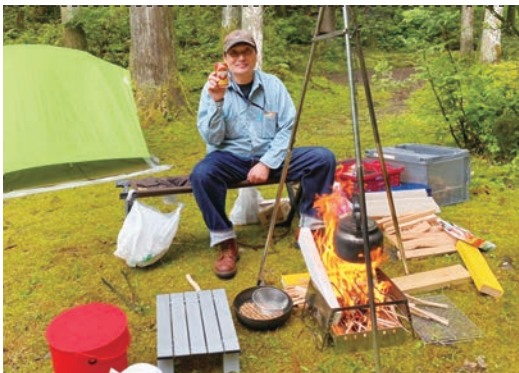
用具の設営から料理まで、キャンプはお手のもの！