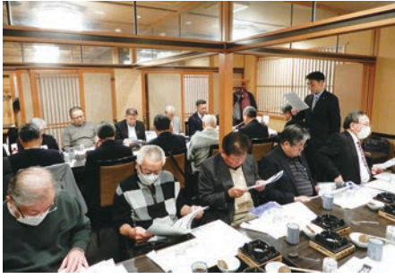
税の知っ得塾 12月6日 木