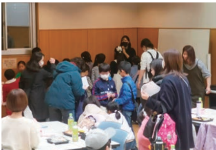
社会貢献 12月7日 木

日本を代表する世界遺産「日光の社寺」。その中でも最も有名な日光東照宮を訪れ、特別参拝をいたしました。その豪華絢爛な美しさは圧巻でした。 次に向かった大谷石地下採掘場跡は、古代の神殿を彷彿とさせる神秘的な光景が広がっていました。 帰りには佐野プレミアムアウトレットで買い物をし、大満足の1日となりました。