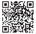
定額減税特設サイト

また、板橋税務署主催の説明会も実施していますので、是非ご参加ください（事前予約制、定員あり）。