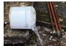
納骨室は、湿気も多く汚れやすい場所ですのでお掃除をお勧めいたします。結露で壺に溜まったお水の除去も行います。