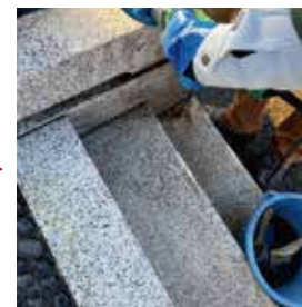
水垢で真っ黒になった階段。専用機材を使用し、隅々まで除去します。