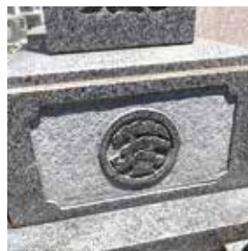
苔の付着したお墓の洗浄と再発防止。