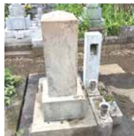
年代物の古石のクリーニング 汚れの状態に合わせて薬剤、洗浄方法を選択します。