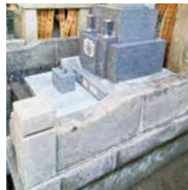
外柵に付着した苔も、洗浄剤で綺麗に除去してもとの色合いに戻ります。