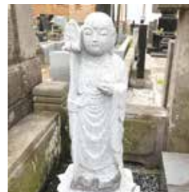
お地蔵様の洗浄。石材のものと色合いに復旧しました。