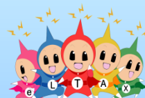
eLTAX イメージキャラクター エルレンジャー

e-Tax ホームページ（ https://www.e-tax.nta.go.jp/ ）をご覧ください。